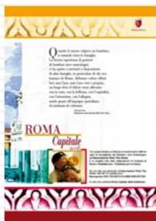
NOVITÀ DEL 2008: FOGLIO INTERNO MOBILE DEDICATO ALL'ASSOCIAZIONE PETER PAN ONLUS