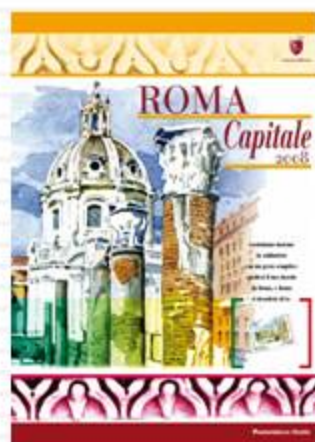
PRIMA PAGINA DEL FOLDER 2008

Ecco qui di seguito i principali prodotti e le novità del 2008: