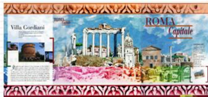
FOLDER 2007, FRONTE

Qui di seguito, alcuni dei prodotti della prima edizione dell'iniziativa: