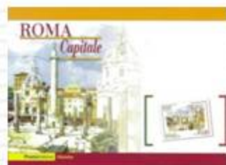
CARTOLINA FILATELICA 2008

N.B. Si ricorda che i Folder di Roma Capitale 2008 sono ancora acquistabili presso tutti i Poste Shop d'Italia sino al 21 Aprile 2009, da Maggio saranno poi messi in vendita i nuovi prodotti di "Una cartolina per Roma 2009".