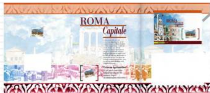
FOLDER 2007, RETRO