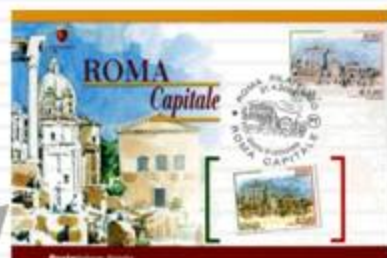
CARTOLINA CON ANNULLO PRIMO GIORNO 21/04/2007